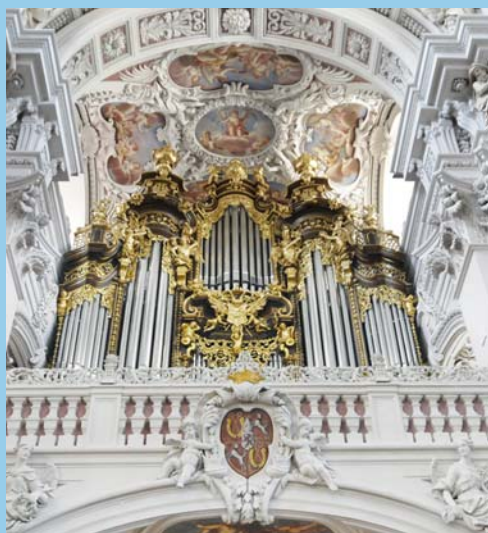
Les notes les plus graves et les plus aiguës du grand orgue de la cathédrale Saint-Étienne sont à peine audibles pour l'oreille humaine.