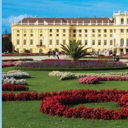
Admirez toute la splendeur du château de Schönbrunn depuis Marie-Antoinette jusqu'à l'empereur François

Bohème, qui domine la silhouette de la ville. Visitez la cathédrale Saint-Guy, voyez les manuscrits originaux de Beethoven au palais Lobkowitz du château de Prague et assistez à un concert privé spécialement organisé, donné par un quatuor à cordes interprétant des œuvres du compositeur. Déambulez dans la ruelle d'Or, où vivaient anciennement des orfèvres dans de petites maisons de style maniérisme datant de la fin du 16 e siècle.