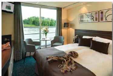
Cabine de catégorie 2

L'équipage international, dont les membres parlent tous l'anglais, offre un accueil chaleureux. Le MS AMADEUS ELEGANT répond aux normes de sécurité les plus élevées et est l'un des rares bateaux fluviaux d'Europe à s'être fait décerner le label écologique « Green Globe ».