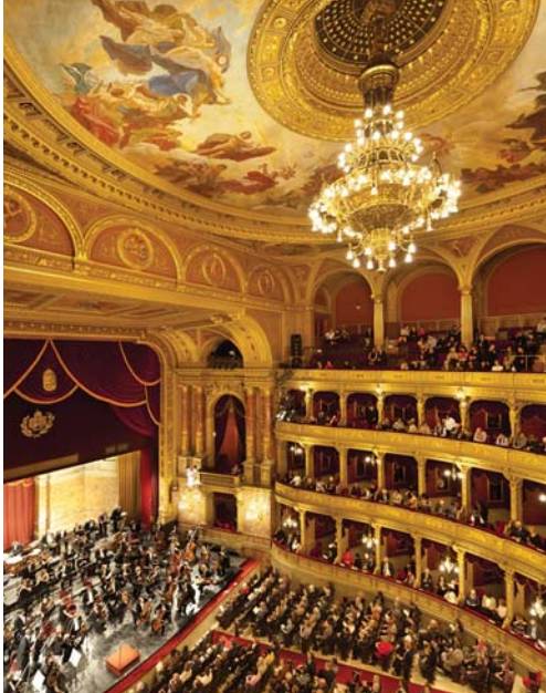
L'Opéra de Budapest est l'un des chefs-d'œuvre de l'architecte Miklós Ybl; son acoustique demeure parmi les meilleures du monde.