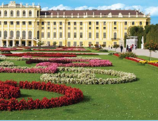
Palais de style rococo, ancienne résidence de la dynastie Habsbourg, aujourd'hui site du patrimoine mondial de l'UNESCO.