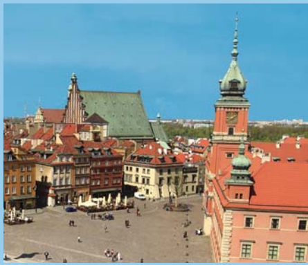
Centre de Varsovie.

Les séjours facultatifs avant et après le programme principal sont offerts moyennant des frais additionnels. Des précisions seront fournies avec la confirmation de votre réservation.