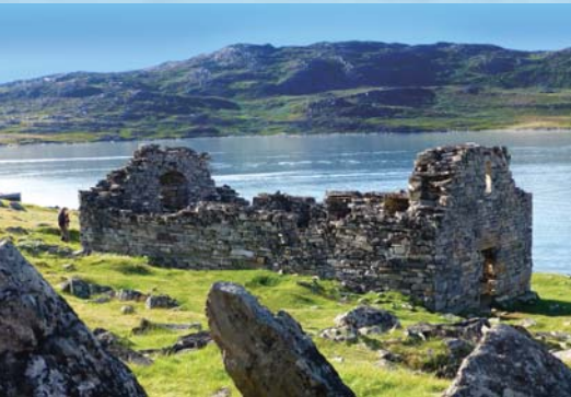
The ruins of Hvalso Church are the best-preserved remnants of Greenland's Norse heritage.

Familiarisez-vous avec la vie des anthropologues et géographes des Expéditions polaires françaises des années 1950 à la base Paul-Émile-Victor , sur le glacier Eqi . Admirez ce glacier de 90 mètres de haut, qui flotte directement dans les eaux froides de l'Arctique. Après une petite randonnée aisée au dessus de la baie, contemplez la vue panoramique d'un des sites les plus spectaculaires de l'Arctique : le glacier Eqi et l'immense calotte polaire. À cet endroit, seuls les rugissements et les craquements de la glace qui se déplace brisent le silence.