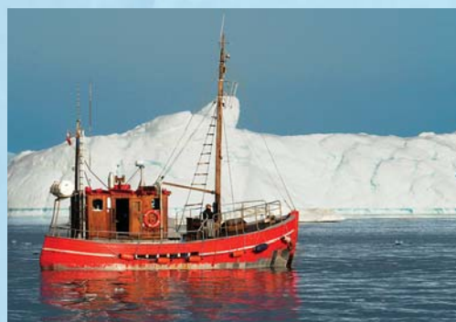
Aujourd'hui encore, comme ils le font depuis des siècles, les bateaux de pêche sillonnent les eaux au large de l'Islande et du Groenland.