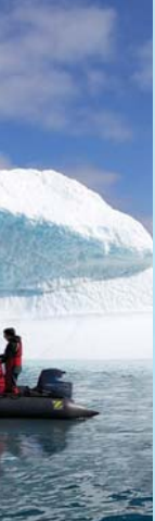
Paysage de glace type d'expédition.