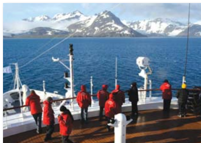
Pont d'observation avant