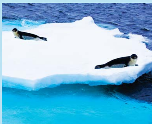
Sortez sur le pont pour observer la faune marine de l'Arctique, comme ces phoques du Groenland qui se reposent sur la glace.

Explorez la côte ouest du Groenland et sa multitude de passages et de floes et observez la faune marine unique de la région.