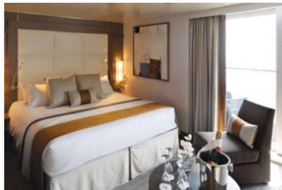
Cabine avec balcon

Les luxueuses cabines et suites, climatisées et spacieuses (de 18,5 à 45 m 2 en superficie) comportent une salle de bain privée avec douche et offrent de somptueuses commodités dignes des hôtels cinq étoiles. La plupart comprennent deux lits jumeaux convertibles en un grand lit à deux places, un régulateur individuel de la température, un téléviseur à écran plat avec réception satellite, l'accès à Internet sans fil, un coffre-fort, un minibar, une garde-robe pleine grandeur, un secrétaire-coiffeuse ainsi que des pantoufles et peignoirs douilllets.