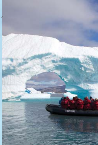
Découvrez de près l'extraordinaire paysage de glace en compagnie des spécialistes de l'équation.