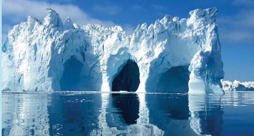
Les glaciers vèlent pour produire des icebergs de toutes les formes et de toutes les tailles, ce qui crée un jardin naturel de sculptures flottantes le long des côtes du Groenland.