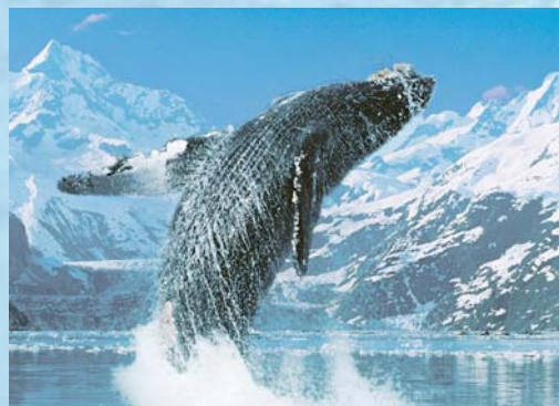
Profitez de cette occasion unique d'observer des baleines à bosse, doux géants insaisissables de l'Arctique.

Après le repas du matin à l'hôtel, rendez-vous à l'aéroport pour le retour au Canada.