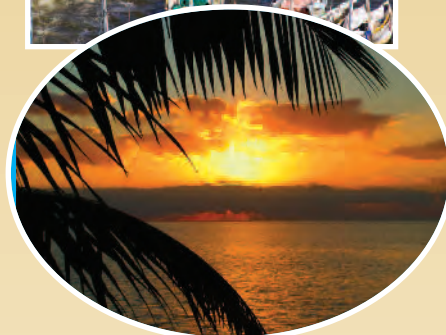
Coucher du soleil à Key West